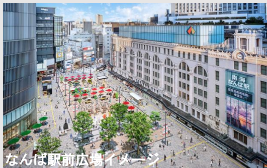
なんば駅前広場イメージ

2024年度中を目途に、駅前ひろばからの連続した高質性を感じられる空間にすべく、なんさん通りの一部歩行者専用道路化及び歩道幅員化工事を実施。 電柱・電線も地中化することで、なんさん通りのイメージは大きく変わります。